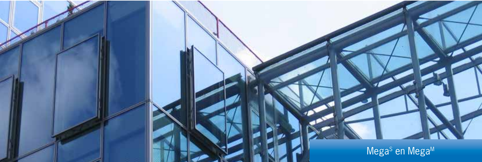
Mega S en Mega M