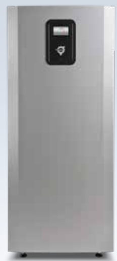
Mega L en Mega XL

A+++ Energieklasse wanneer de warmtepomp onderdeel is van een geïntegreerd systeem. A++ Energieklasse wanneer de warmtepomp de enige warmteopwekker is. Energieklasse overeenkomstig Eco-design richtlijn 811/2013.